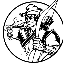
QUESTOR the Elf