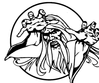
MERLIN the Wizard

U.S. Gold Ltd., Units 2/3 Holford Way, Holford, Birmingham B6 7AX. Telephone: 021 356 3388